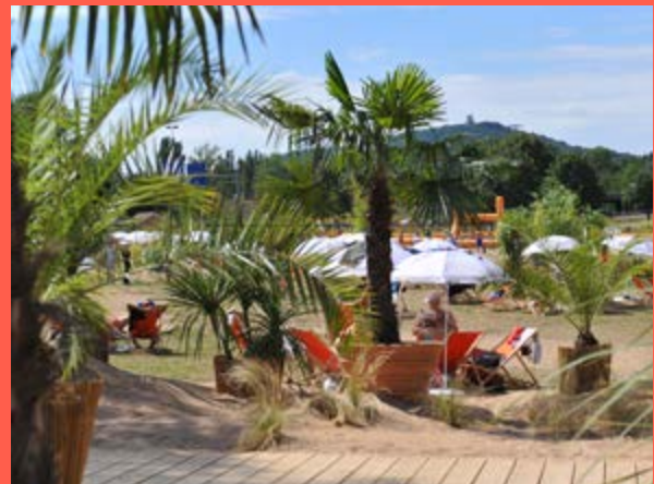
Metz Plage