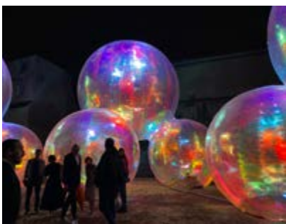
Evanescent - Atelier Sisu

Fort du succès de l'édition 2022 qui a accueilli près d'un million de visiteurs, le festival Constellations de Metz revient pour une 7 ème édition. Tout l'été, la Ville de Metz fait scintiller vos soirées avec un parcours numérique composé d'installations lumineuses artistiques, interactives et ludiques. Un parcours art et jardins et une programmation d'art urbain sont également