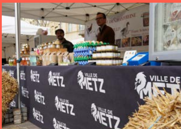
Marché fermier des producteurs