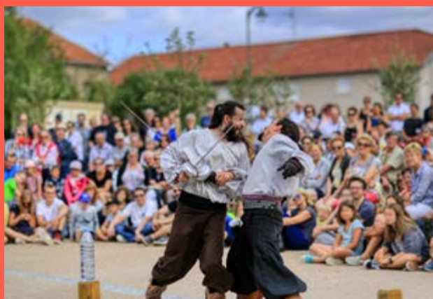
Festival Hop Hop Hop