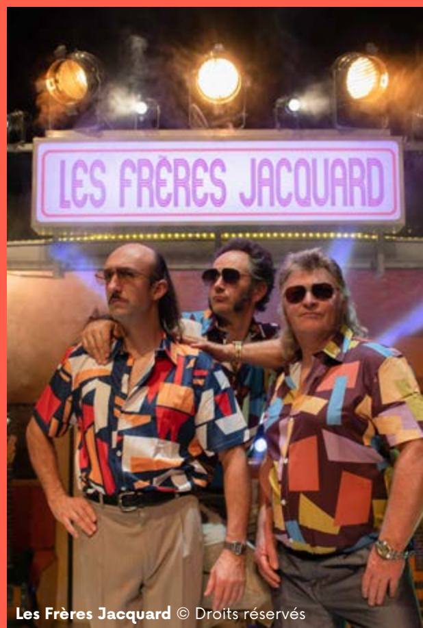
Les Frères Jacquard