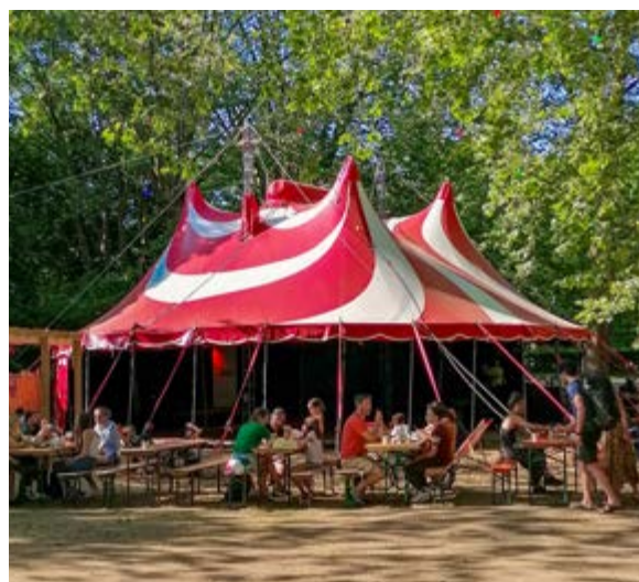
Les Frigos

En plus de ces deux bars, le Schmoutz, un espace de restauration, propose sa cuisine locale simple mais savoureuse en plus des brunchs du dimanche.