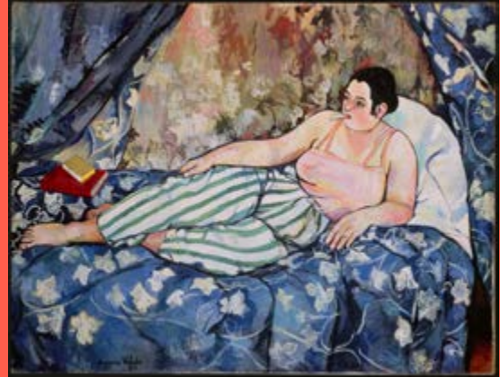
Suzanne Valadon, La Chambre Bleue, 1923