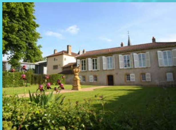
© Maison de Robert Schuman - Inspire Metz