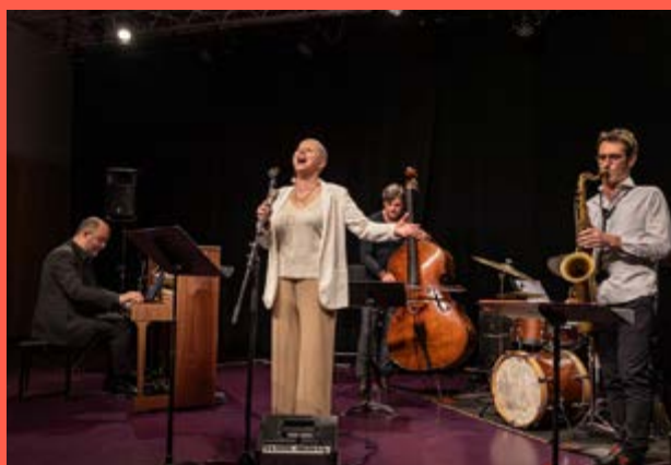
Concert Jazz de Damien Prud'homme