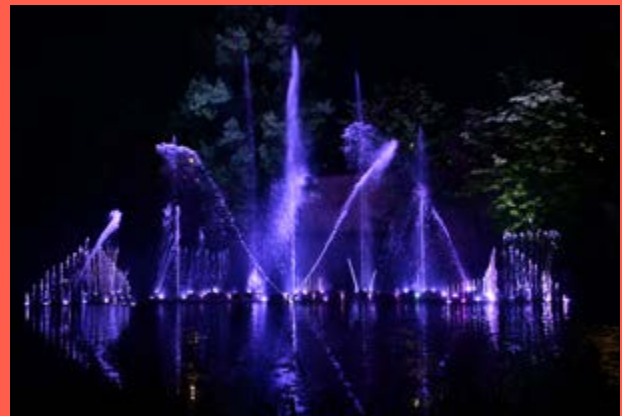
Les Fontaines Dansantes