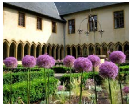
Cloître des Récollets - Haut-Lieu de l'Écologie Urbaine