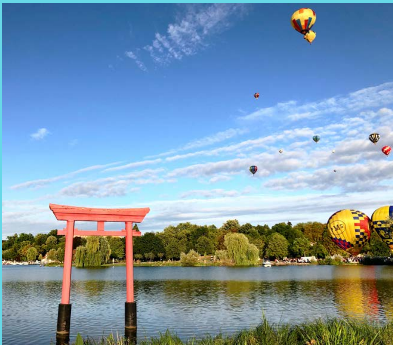
Montgolfiades de Metz