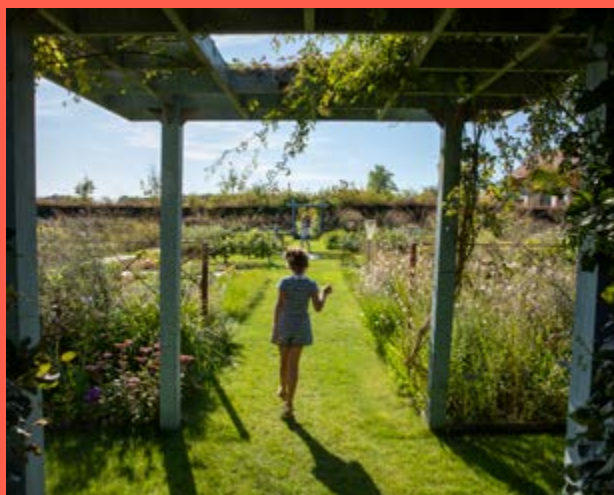
Les Jardins Fruitiers de Laquenexy