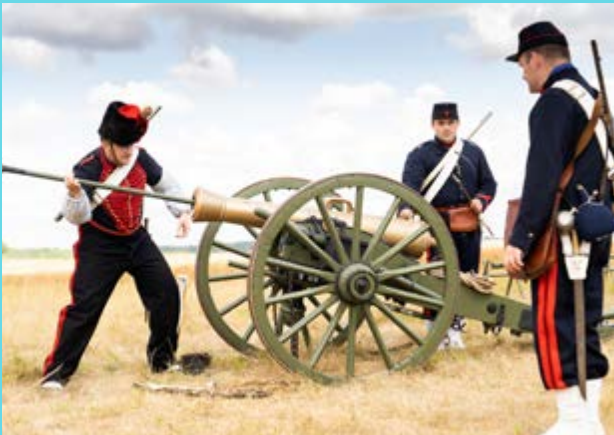
Musée de la Guerre de 1870 et de l'Annexion