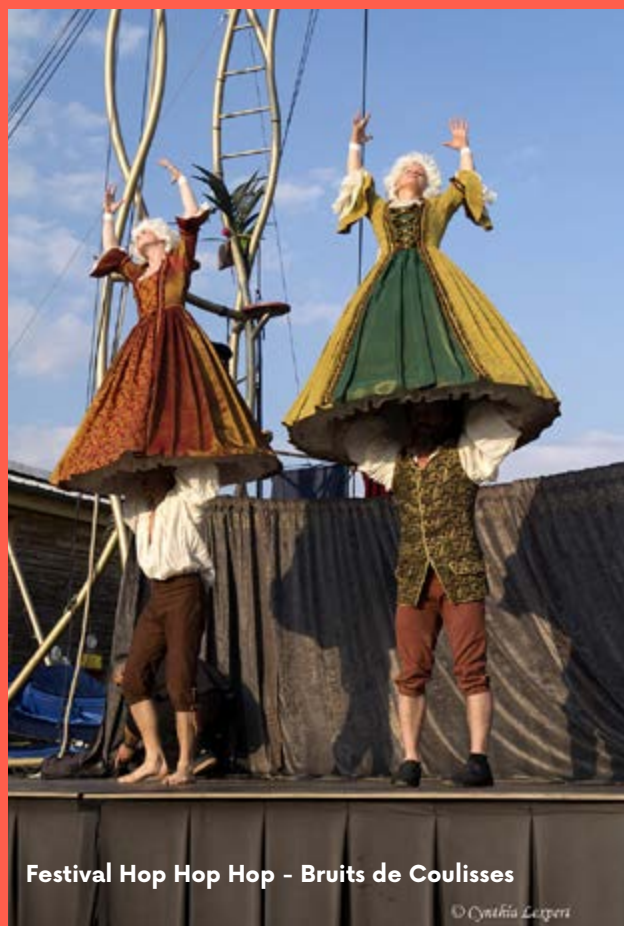
Festival Hop Hop Hop - Bruits de Coulisses