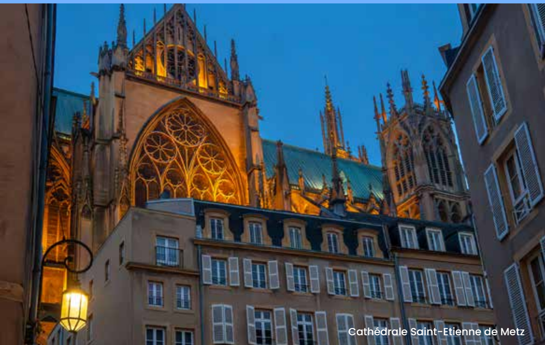
Cathédrale Saint-Étienne de Metz