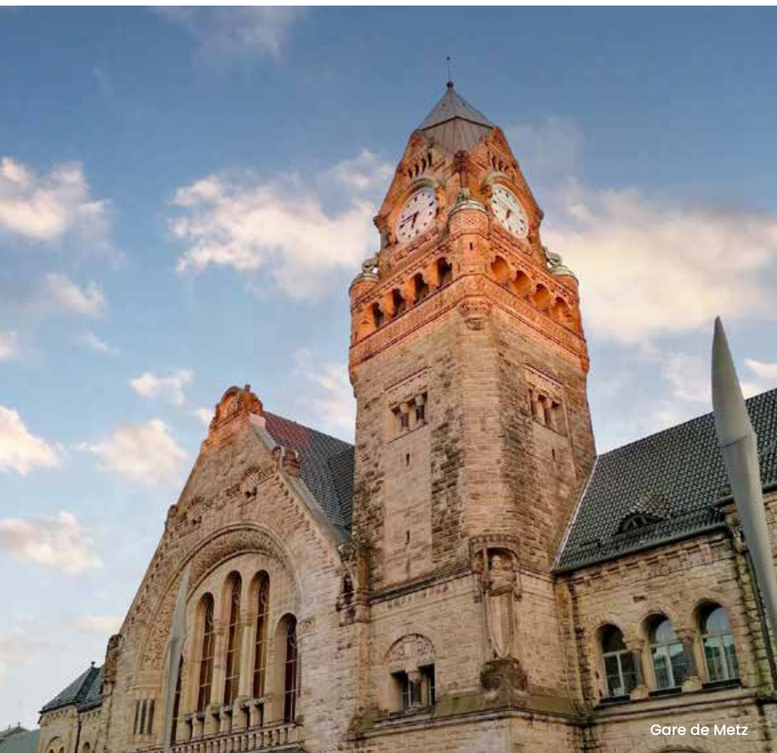
Gare de Metz

Par ses dimensions, son histoire et sa symbolique, la gare de Metz reflète une époque novatrice, mais également tourmentée. Construite pendant l'annexion allemande, elle fut inaugurée en 1908. De nos jours, elle a été élue à 3 reprises « plus belle gare de France ».