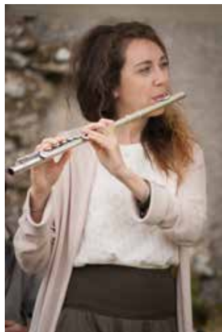
Visite en musique

Autour de l'Esplanade et de son histoire, redécouvrez d'une manière originale et décalée les monuments marquants de cette place centrale de la ville de Metz ! Aux sons de la flûte traversière et du chant, menés par une historienne-musicienne, vous vous laisserez embarquer dans un passé riche et passionnant, et redécouvrirez le patrimoine comme vous ne l'avez jamais vu... ni entendu.»