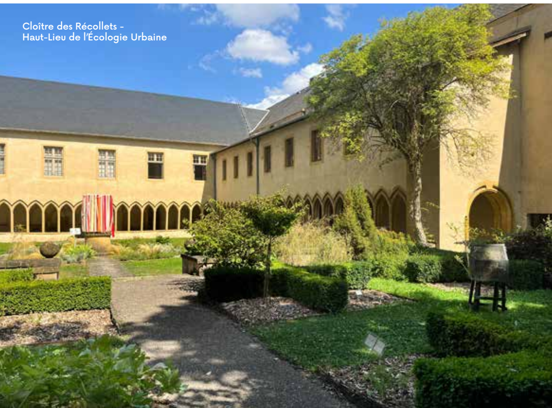
Cloître des Récollets - Haut-Lieu de l'Écologie Urbaine

En découvrant les merveilles architecturales de la cathédrale Saint-Etienne à l'Opéra-Théâtre de Metz, vous plongerez dans les richesses de l'architecture du Moyen-Âge et du Siècle des Lumières.