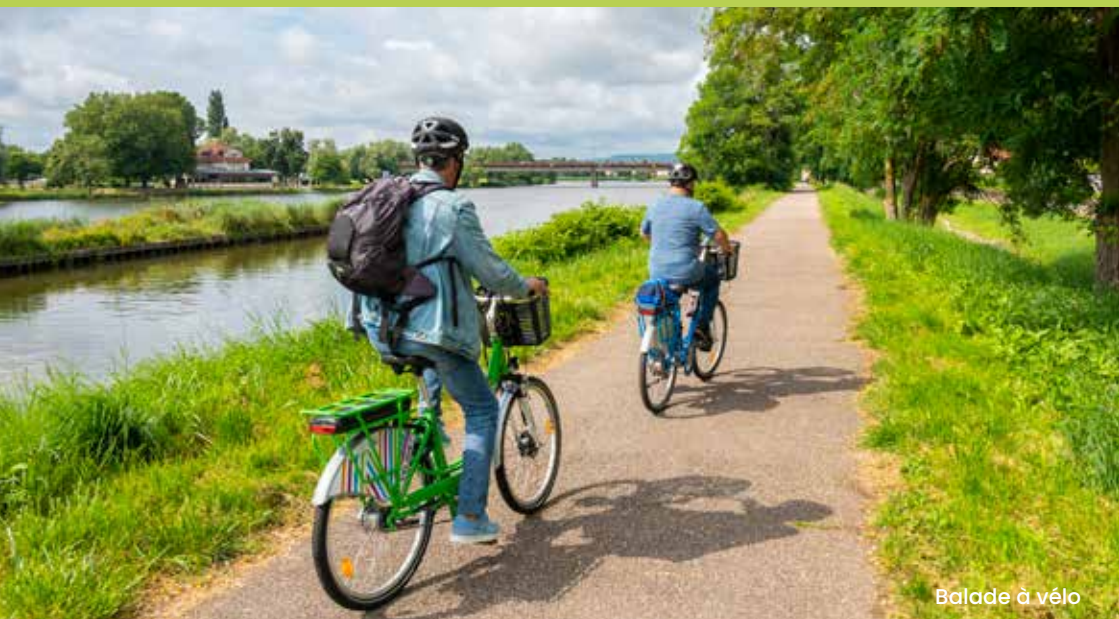
Balade à vélo