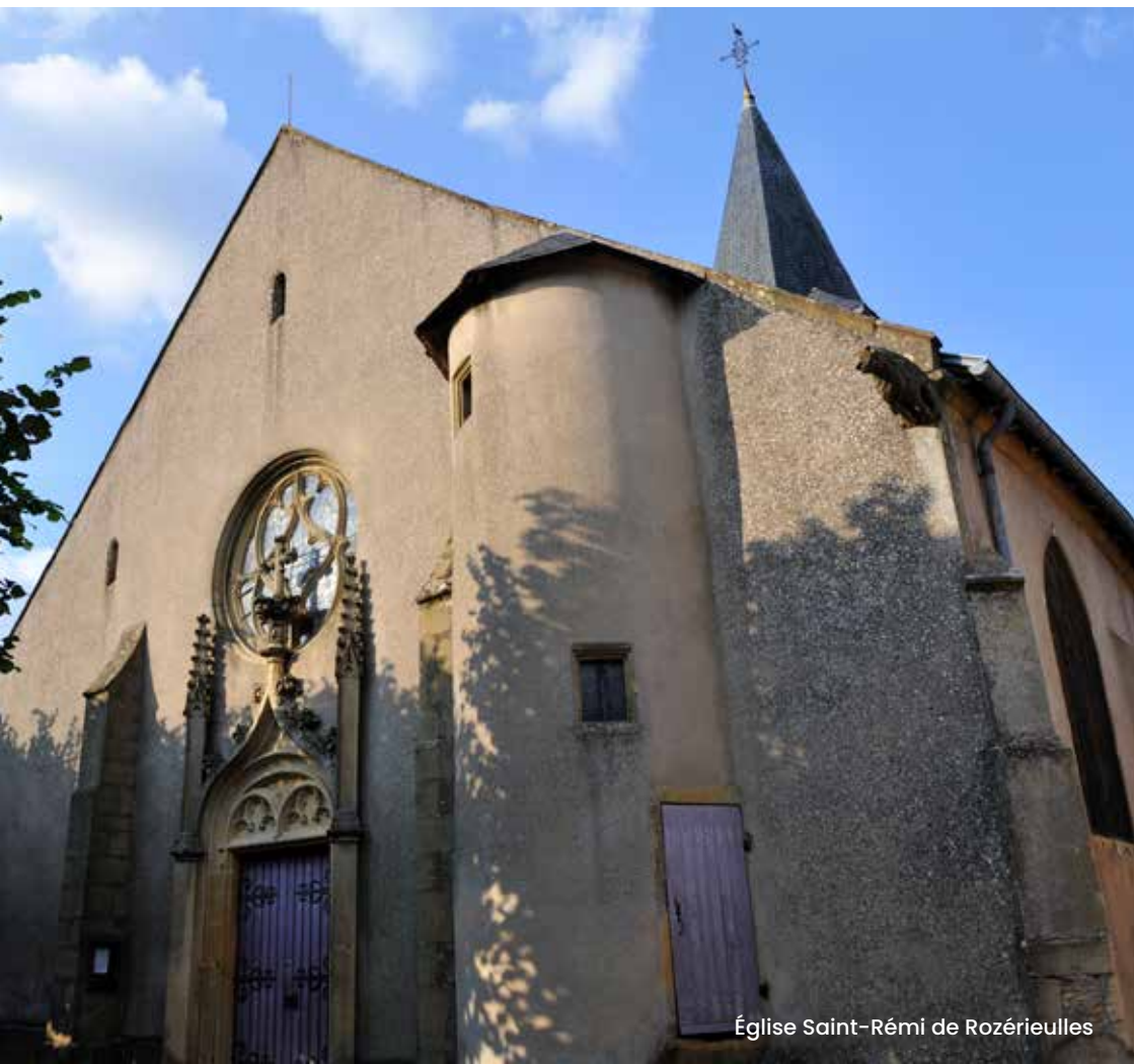
Église Saint-Rémi de Rozérieulles

Ancien village de vignerons sur la voie romaine de Verdun, Rozérieulles dépendait du pays messin au Moyen Âge. Les familles messines y possédaient d'importants domaines. Vous découvrirez l'église Saint-Rémi du XIII ème siècle et le cimetière franco-allemand implanté dans la commune.