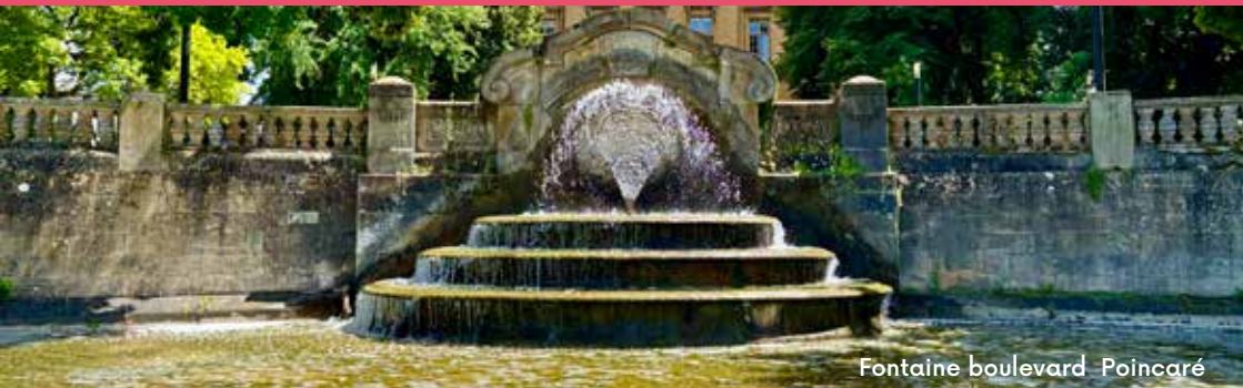
Fontaine boulevard Poincaré