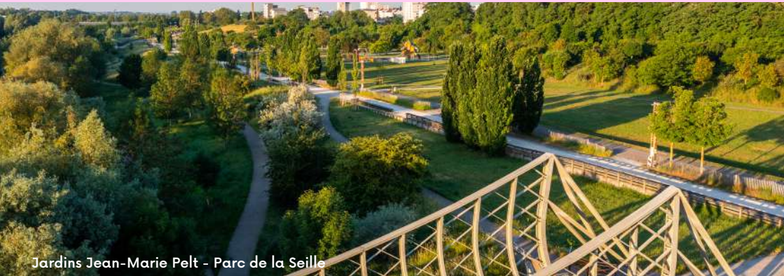
Jardins Jean-Marie Pelt - Parc de la Seille