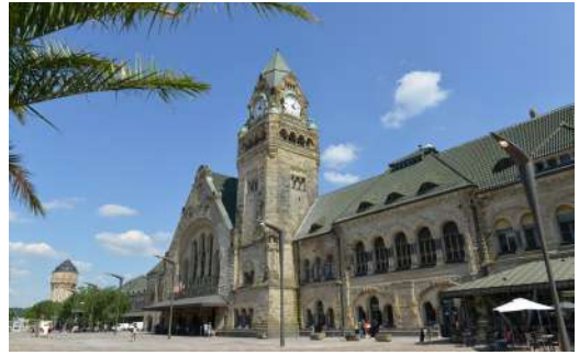
Gare de Metz

En une heure seulement, laissez-vous entraîner par un guide passionné à travers les trésors de Metz. Découvrez les secrets cachés du patrimoine messin et admirez la majesté de la cathédrale sous un nouvel angle, le tout en plein air ! Inscriptions jusqu'au samedi à 17h.