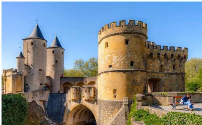
Porte des Allemands

Entre les deux édifices religieux emblématiques de la cité médiévale, dont les silhouettes dominaient la cité, vous découvrirez la ville du siècle des Lumières, façonnée au XVIII ème siècle par le maréchal de Belle-Isle (Cathédrale en extérieur).