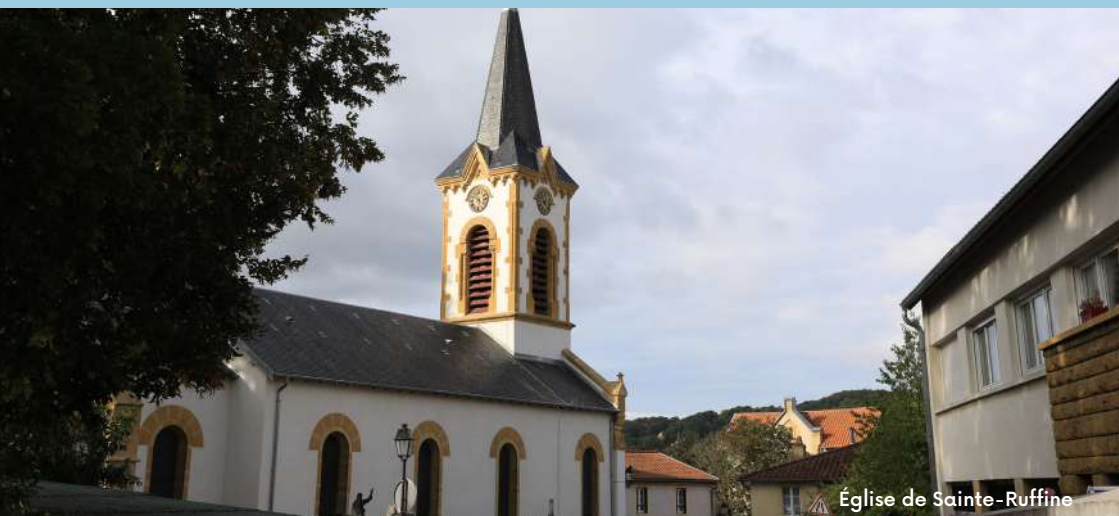
Église de Sainte-Ruffine