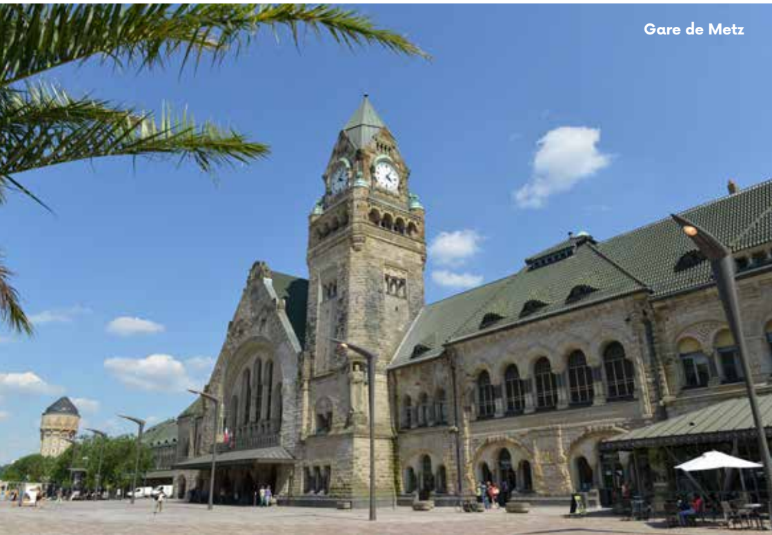
Gare de Metz