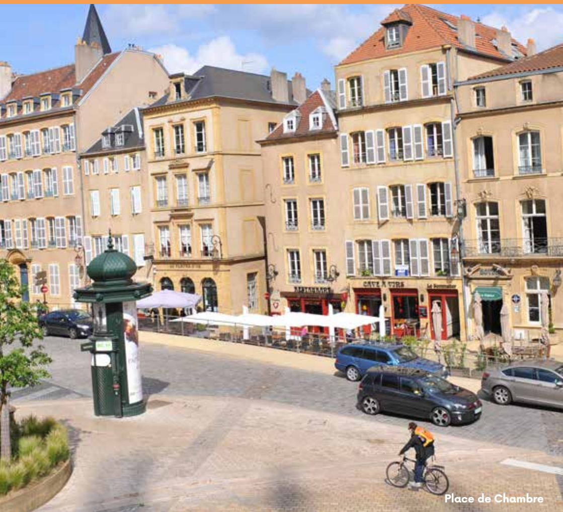
Place de Chambre