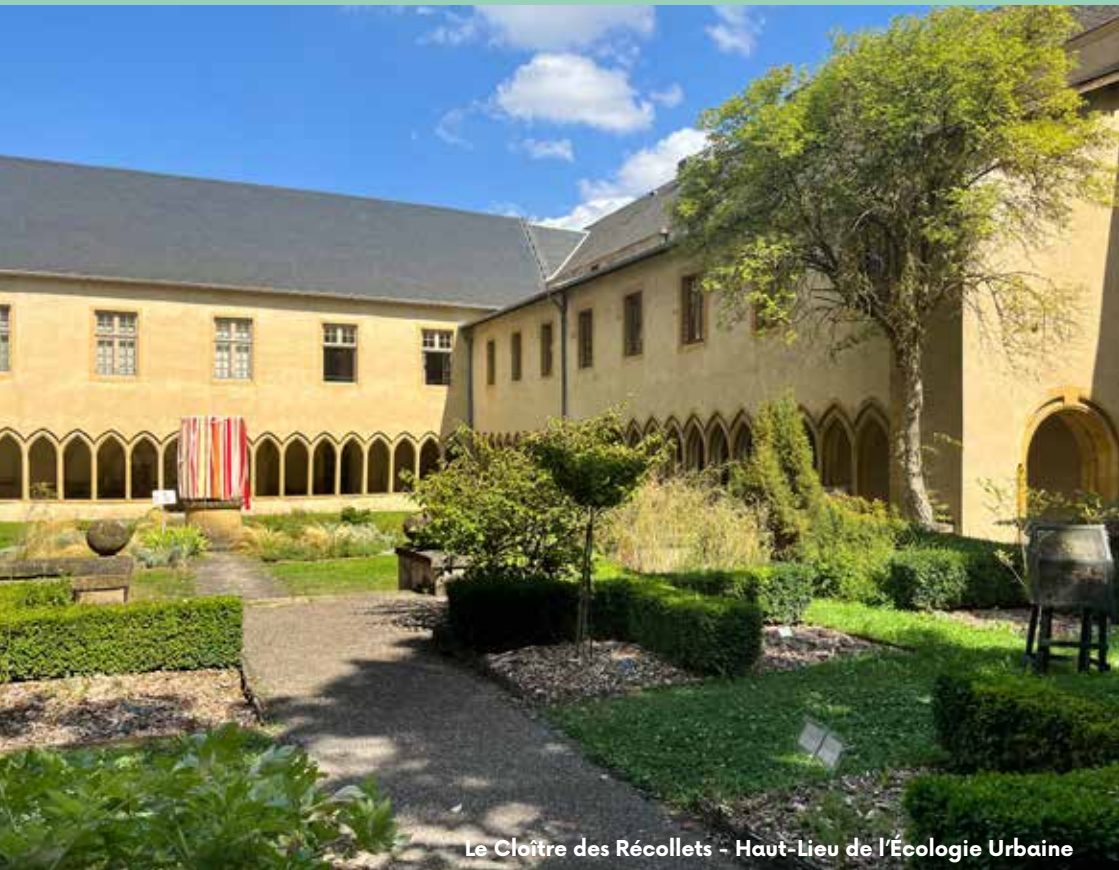
Le Cloître des Récollets - Haut-Lieu de l'Écologie Urbaine