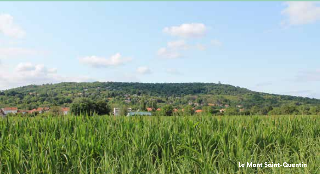
Le Mont Saint-Quentin