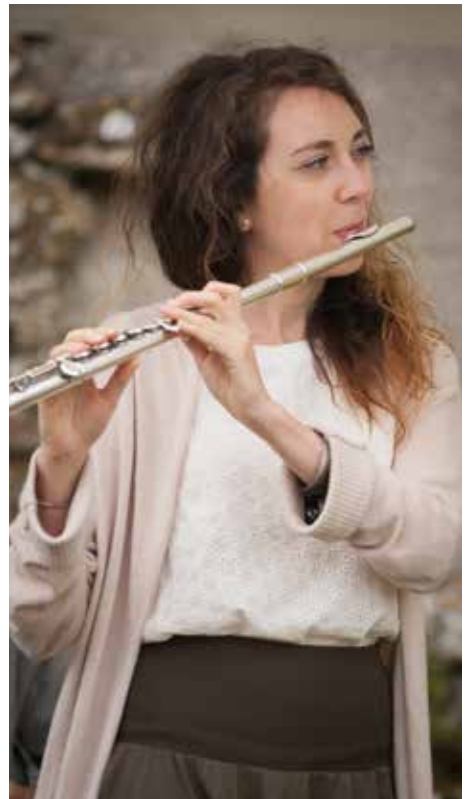
Visite musicale

Autour de l'Esplanade et de son histoire, redécouvrez d'une manière originale et décalée les monuments marquants de cette place centrale de la ville de Metz ! Aux sons de la flûte traversière et du chant, menés par une historienne-musicienne, vous vous laisserez embarquer dans un passé riche et passionnant, et redécouvrirez le patrimoine comme vous ne l'avez jamais vu... ni entendu.