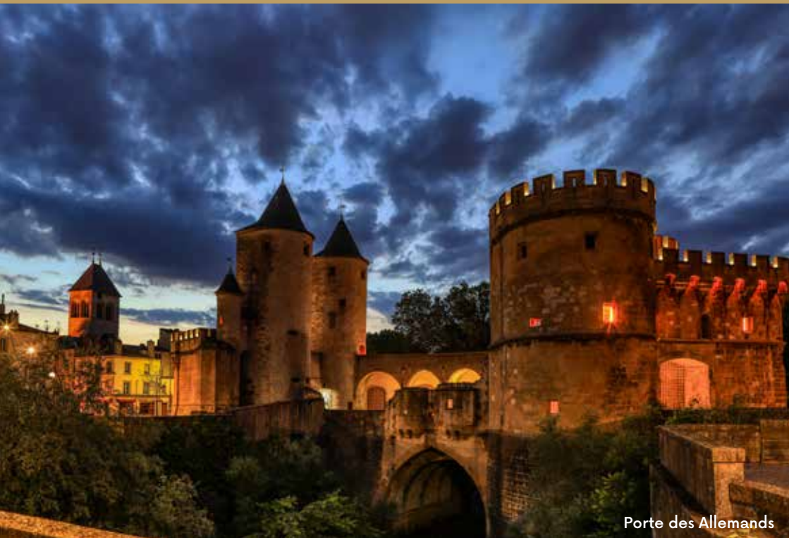
Porte des Allemands