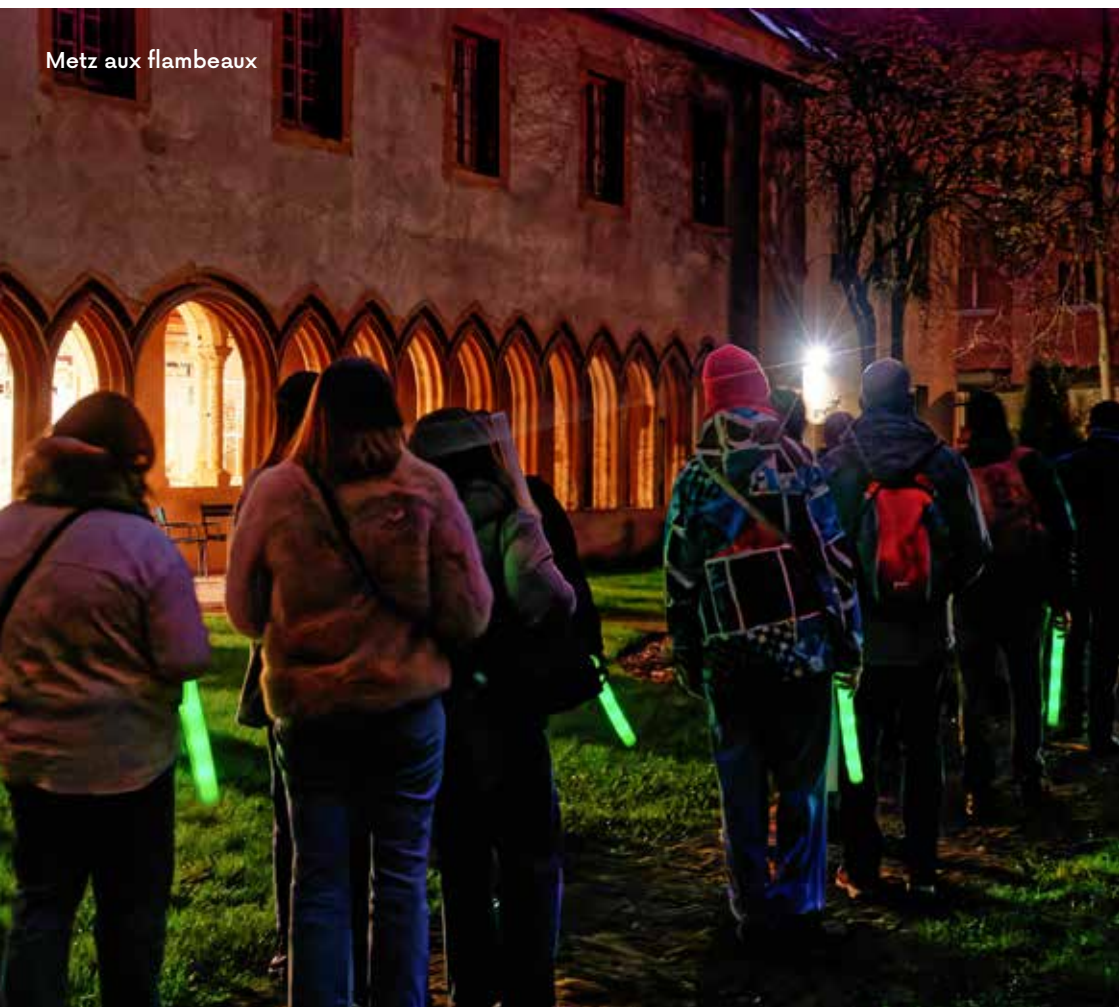
Metz aux flambeaux

Envie de découvertes insolites, d'histoires frissonnantes à la lumière des flambeaux dans l'obscurité des rues médiévales ? Cette visite est faite pour vous ! Suivez le guide... (15 personnes maximum)