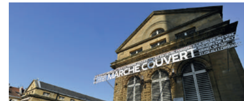
Marché couvert de Metz.

Dégustez les produits du terroir lorrain sur les nombreux marchés de l'Eurométropole de Metz. Marchés du terroir, thématiques et au fil des saisons: calendrier disponible sur tourisme-metz.com .