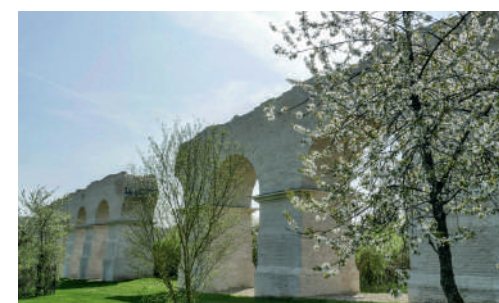
Aqueduc romain à Ars-sur-Moselle.