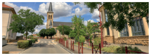
Commune de Saint-Privat-la-Montagne.