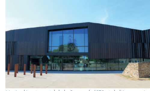
Musée départemental de la Guerre de 1870 et de l'Annexion à Gravelotte.