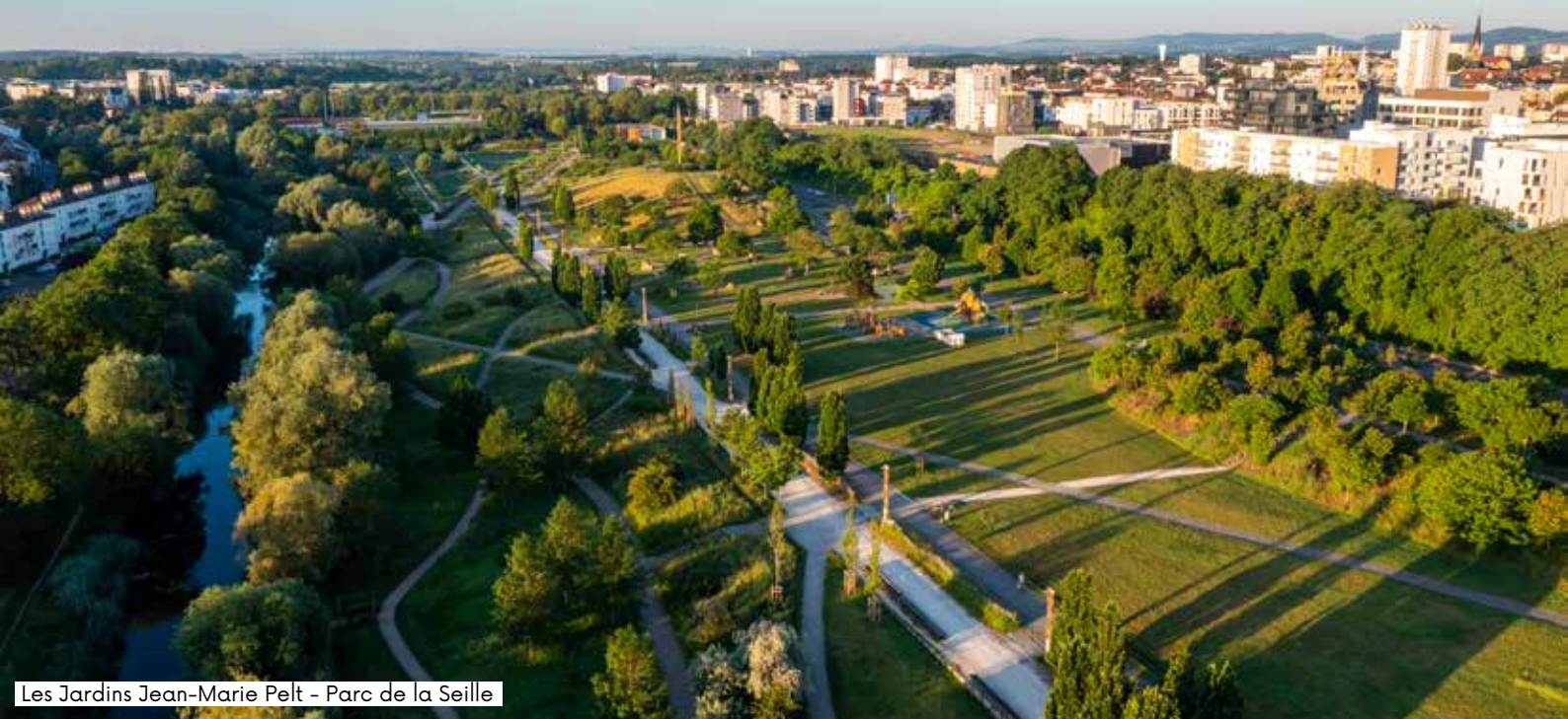
Les Jardins Jean-Marie Pelt - Parc de la Seille