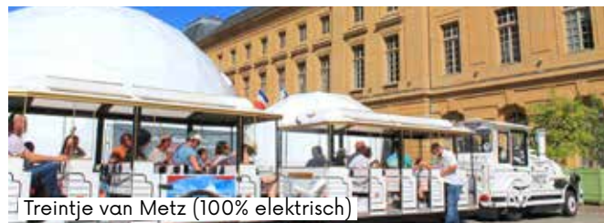
Treintje van Metz (100% elektrisch)

Om bezoekers fietstochten te kunnen aanbieden heeft agentschap Inspire Metz - VVV een overeenkomst gesloten met LE MET', het openbaarvervoernetwerk van de Eurometropool Metz.