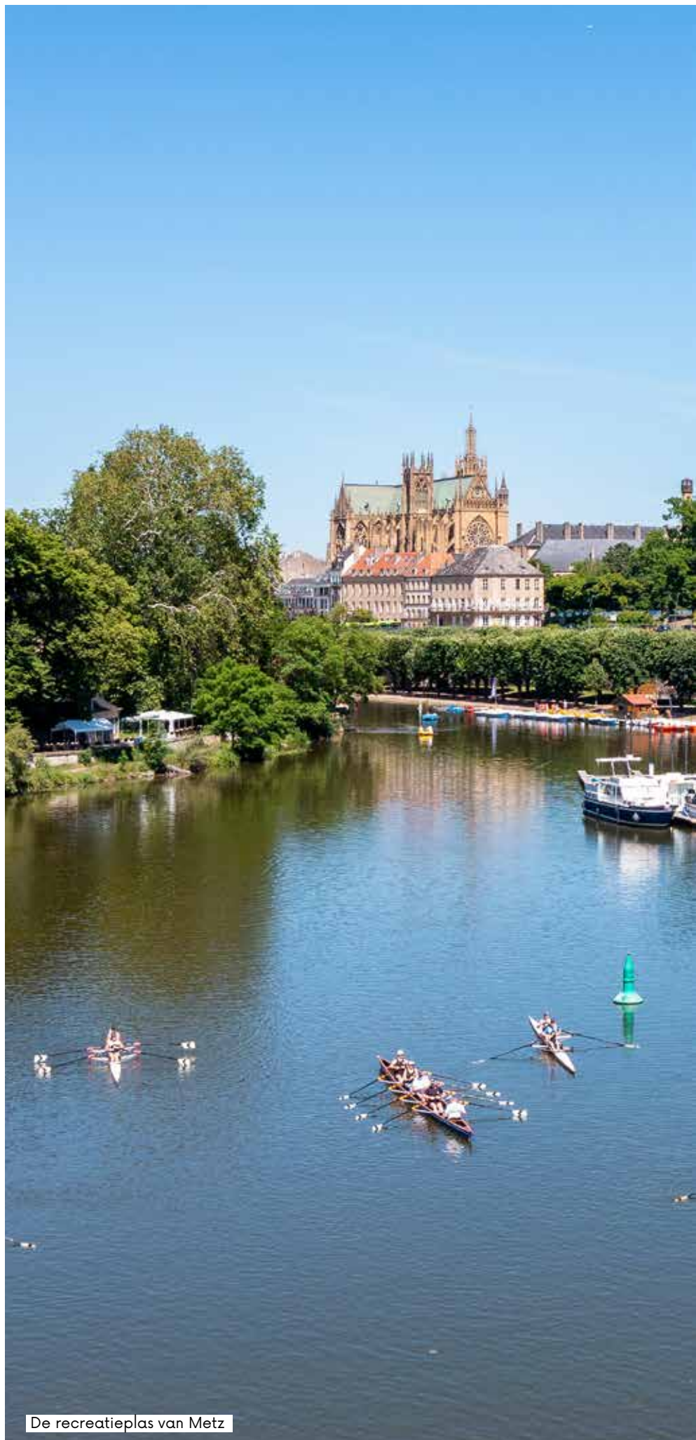
De recreatieplas van Metz

Fotocredits : Sutter Event ; Studio Hussenot ; Yath ; Philippe Gisselbrecht - Ville de Metz ; Metz Métropole ; Agence Inspire Metz. Icônes : Freepik.