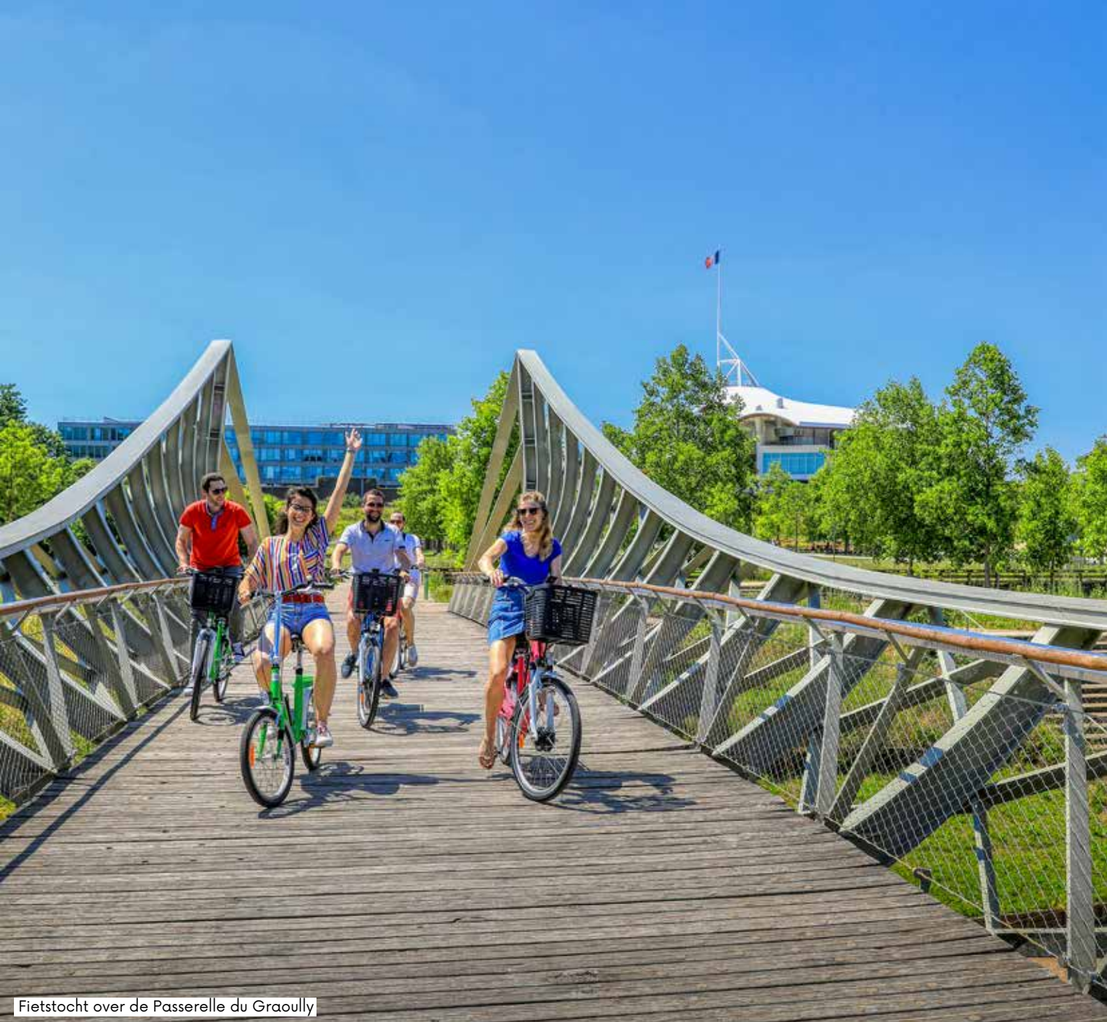
Fietstocht over de Passerelle du Graouilly