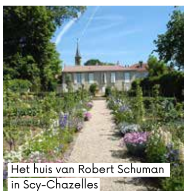
Het huis van Robert Schuman in Scy-Chazelles

Deze Merovingische archeologische opgraving trekt niet alleen de liefhebbers van geschiedenis, maar is ook populair bij wandelaars. De ligging en uitgestrektheid van de gemeente, waaronder een bosgebied, maken dat er maar liefst 7 wandelpaden zijn uitgezet.