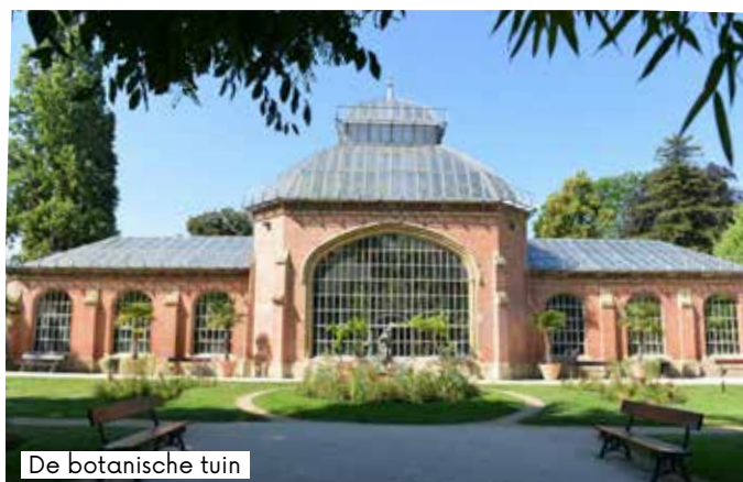
De botanische tuin

En tenslotte is het een dynamisch gebied waarin ook economische activiteiten (landbouw, wijnbouw) en vrijetijdsactiviteiten (buitensport) hun plaats hebben.