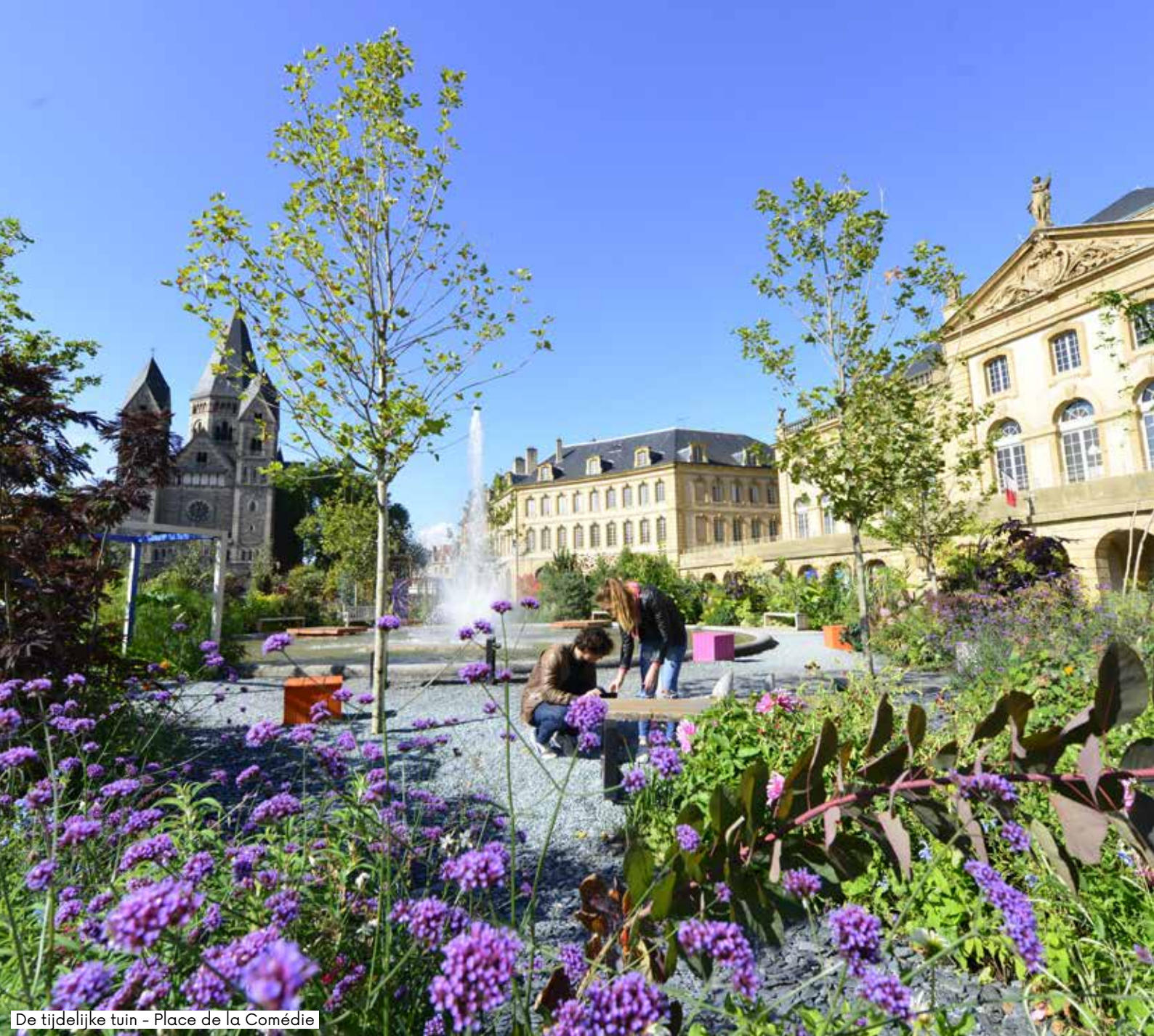
De tijdelijke tuin - Place de la Comédie