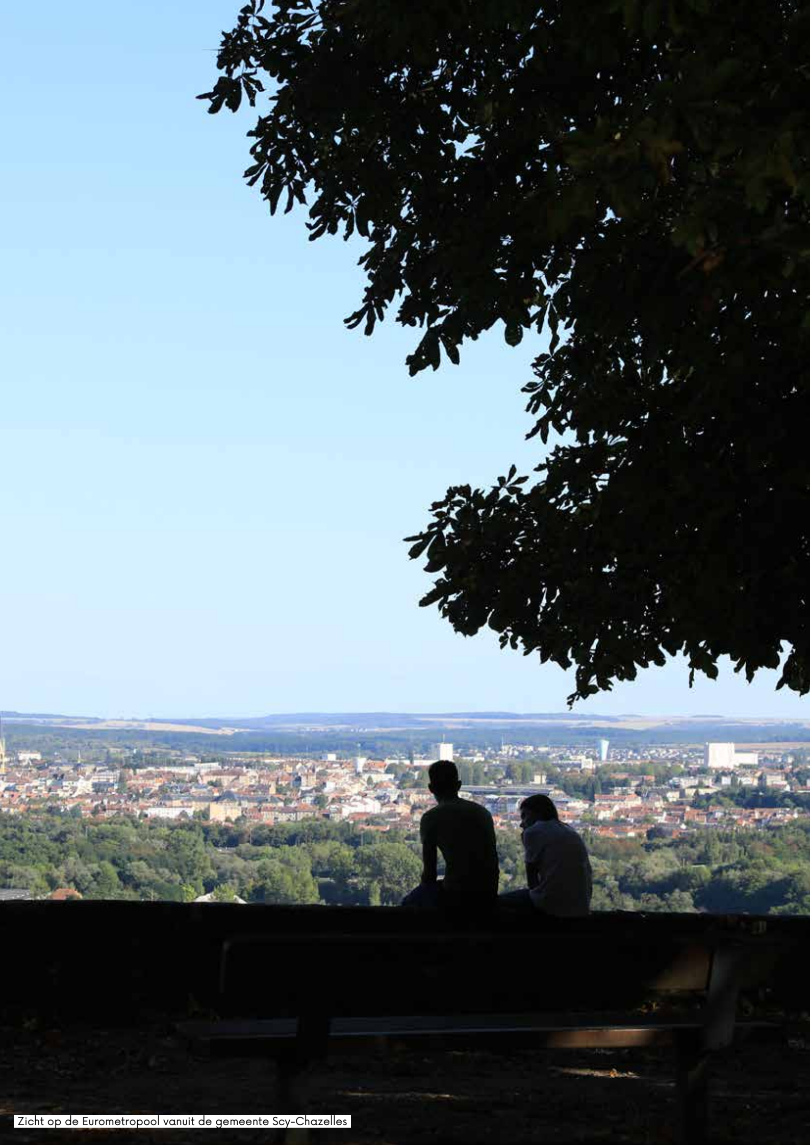
Zicht op de Eurometropool vanuit de gemeente Scy-Chazelles