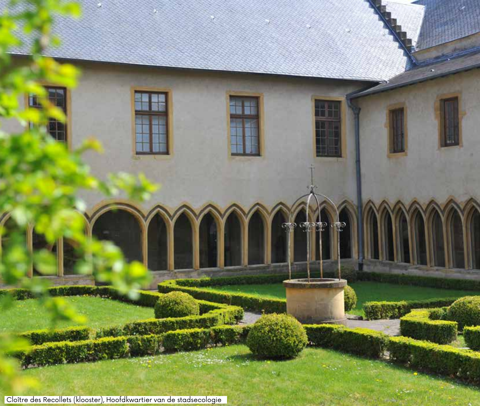
Cloître des Recollets (klooster), Hoofdkwartier van de stadsecologie