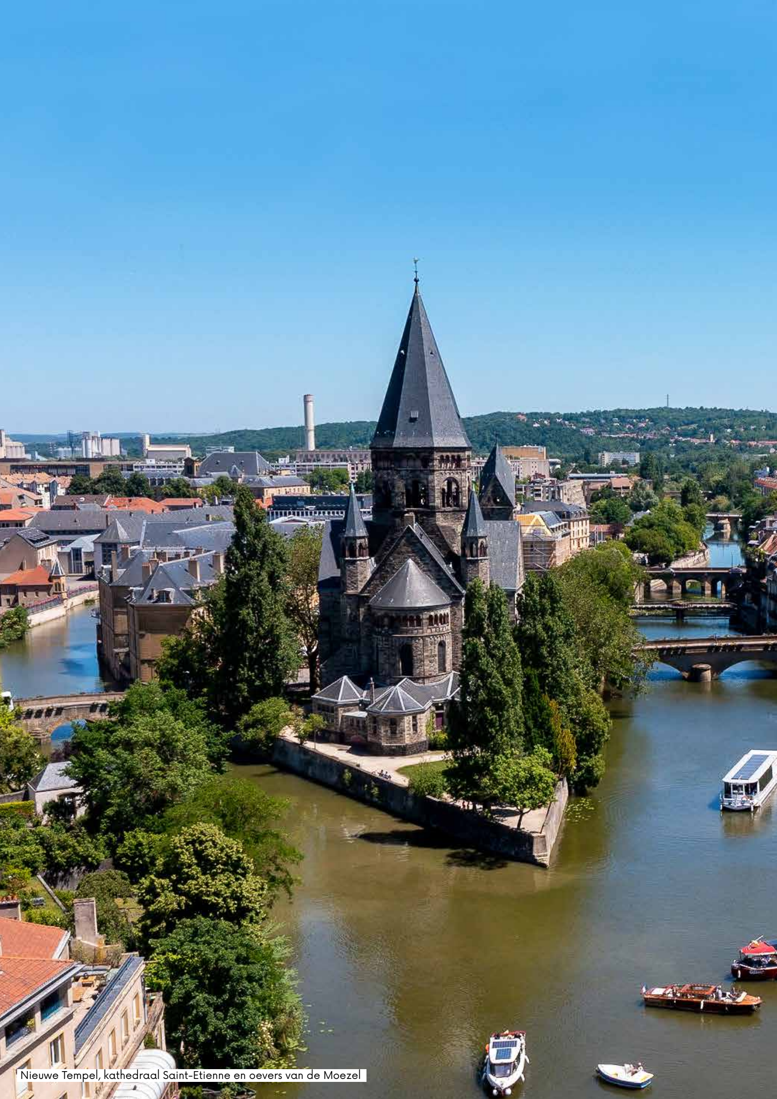
Nieuwe Tempel, kathedraal Saint-Etienne en oevers van de Moezel