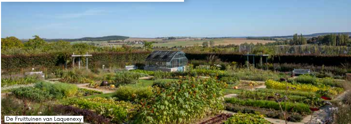
De Fruittuinen van Laquenexy