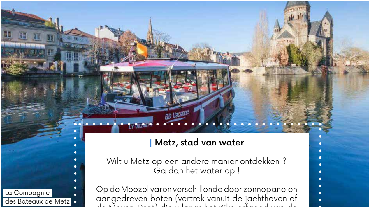
La Compagnie des Bateaux de Metz