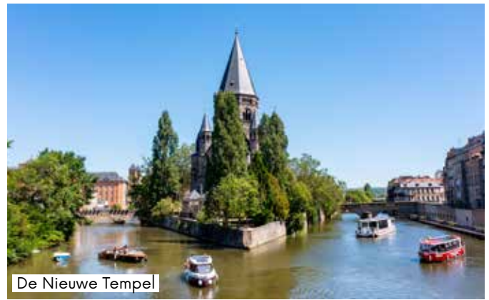
De Nieuwe Tempel