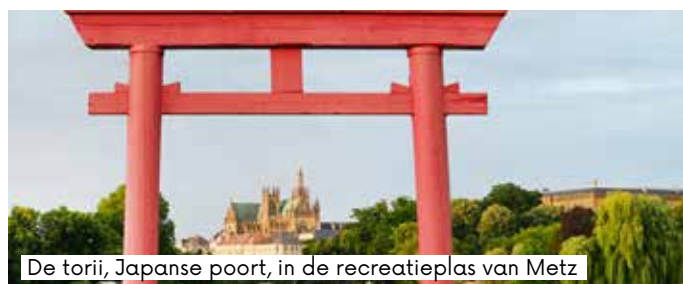
De torii, Japanse poort, in de recreatieplas van Metz

Liefhebbers van natuurwetenschappen of vogelkunde kunnen vogels observeren in het Parc du Pas du Loup, natuurgebied en symbool voor het zero-bestrijdingsmiddelenbeleid dat de stad sinds 2007 voert.