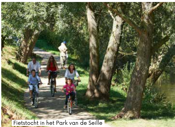
Fietstocht in het Park van de Seille

Met City Pass profiteert u binnen de Eurometropool en zijn omgeving van diverse kortingen en aanbiedingen. Waaronder : 1 dag onbeperkt openbaar vervoer met de Visi Pass binnen het LE MET' netwerk.