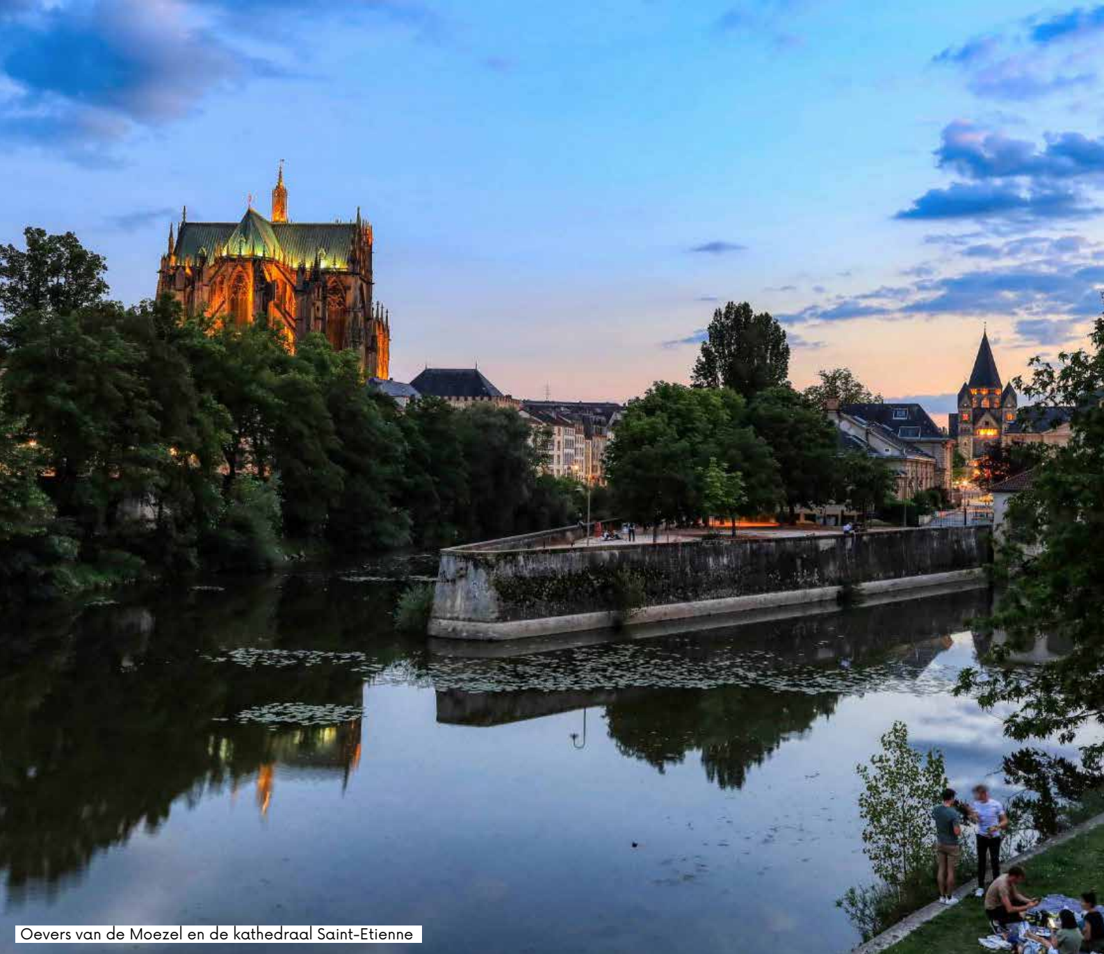
Oevers van de Moezel en de kathedraal Saint-Etienne