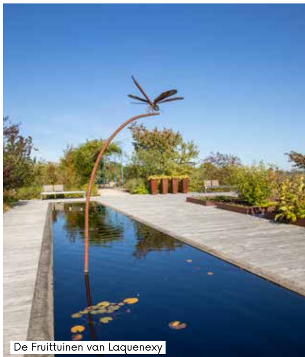
De Fruittuinen van Laquenexy

Voor meer informatie : www. jardinsfruitiersdelaquenexy.com