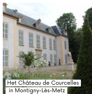
Het Château de Courcelles in Montigny-Lès-Metz