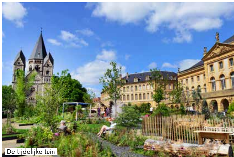
De tijdelijke tuin

De Dienst Groenvoorziening van de stad Metz, die verantwoordelijk is voor parken, tuinen en natuurgebieden, zorgt ook dit jaar weer voor een nieuwe tijdelijke groene creatie die het plein van het Operathater zal opfleuren in de periode van 26 juni tot midden oktober. Het is een extra tuin die voor één zomer wordt gecreëerd op een van de bestrate pleinen van de stad.