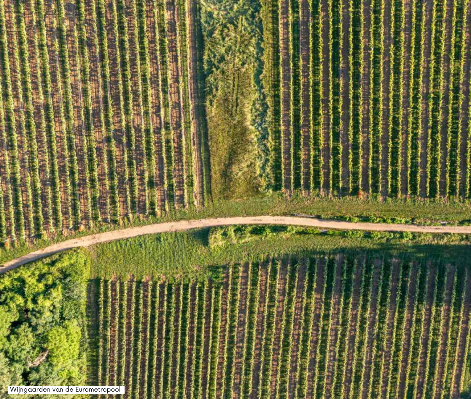
Wijngaarden van de Eurometropool