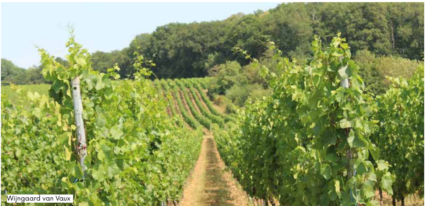
Wijngaard van Vaux

Druivenrassen : van delicate en lichte wijnen afkomstig van de druivenrassen pinot en auxerrois tot een gevarieerd en rijk smaakpalet: pinot noir, pinot gris, auxerrois, Müller-Thurgau, pinot blanc, riesling, gewurztraminer en gamay. Deze wijnen passen goed bij een een hartige taart of een soep.