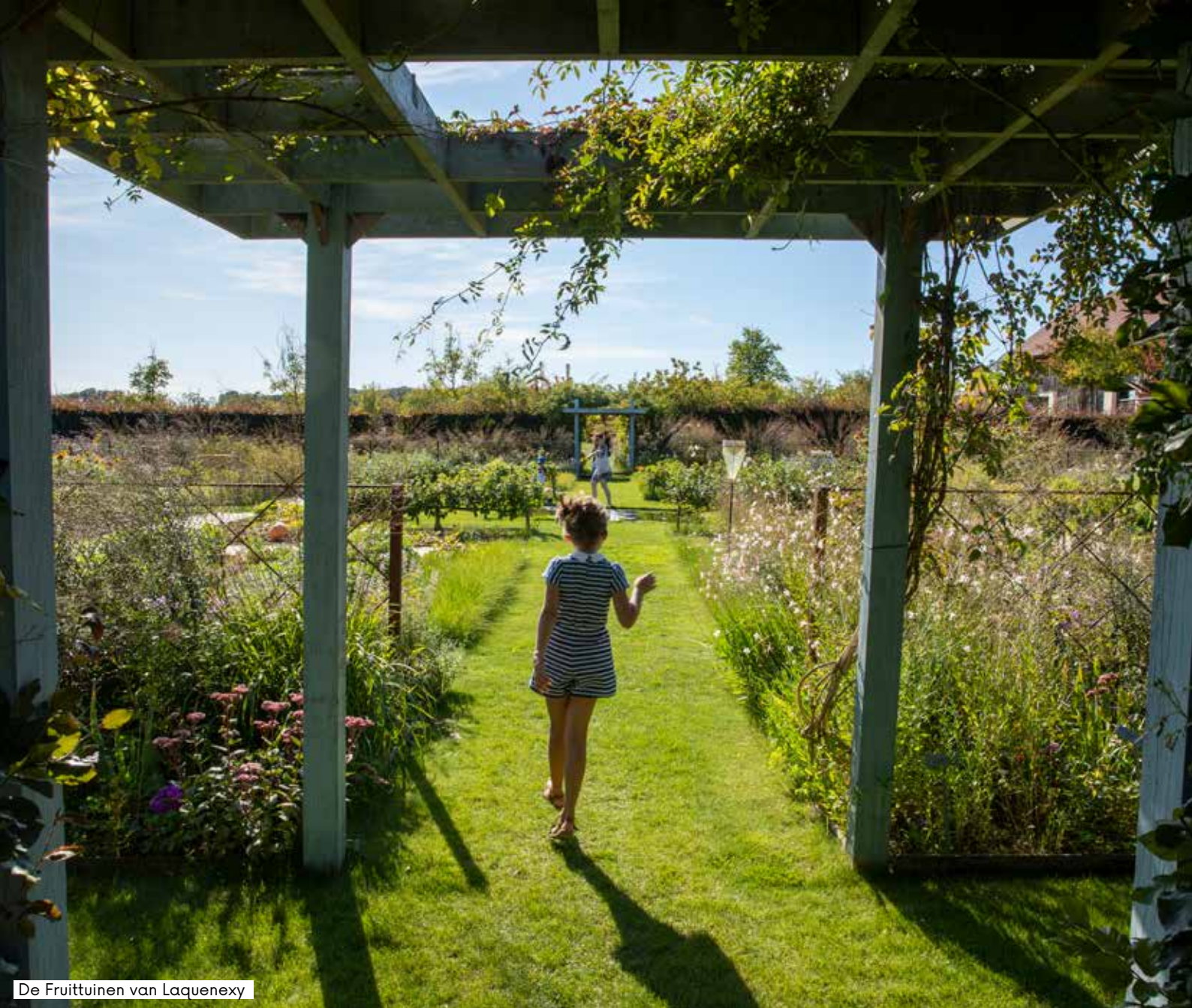
De Fruittuinen van Laquenexy