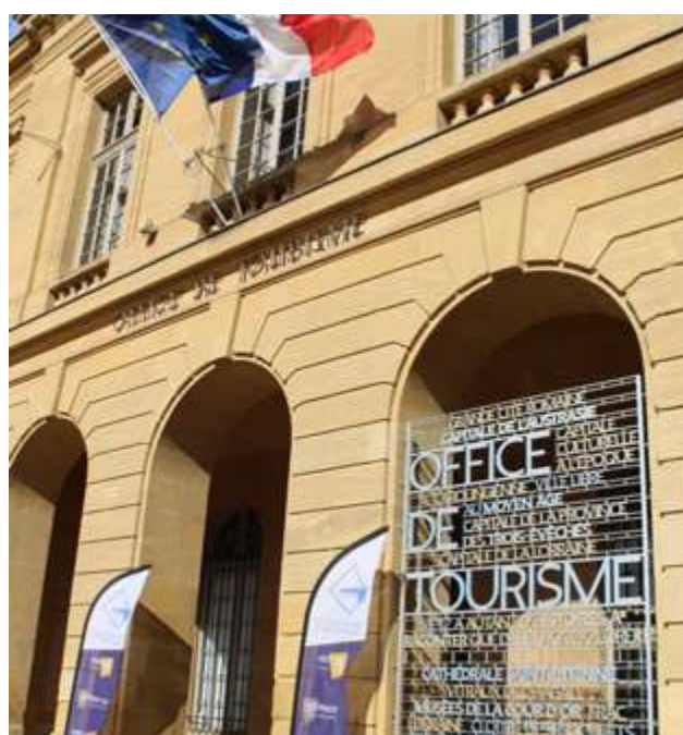
Office de Tourisme - agence Inspire Metz