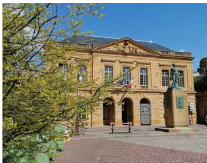
Agence Inspire Metz - Office de Tourisme