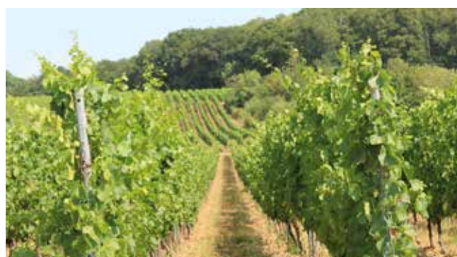
Vignoble de l'Eurométropole de Metz